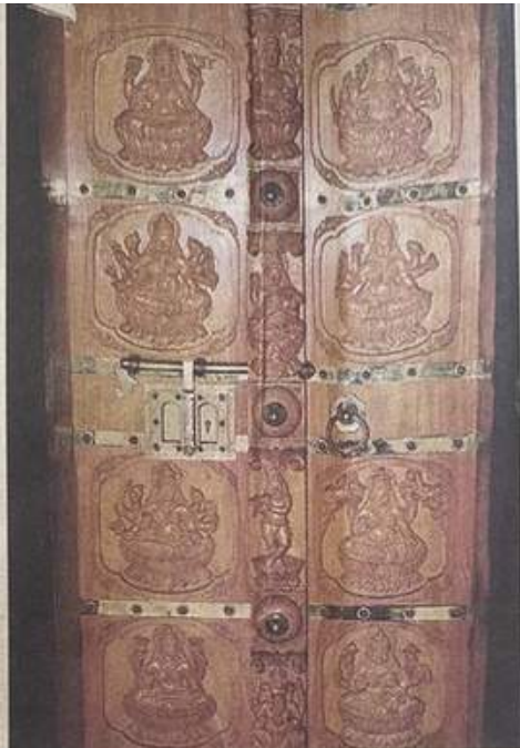
പെരുമ്പല്ലൂർ കോട്ടുകുറുമ്പ ഭഗവതി ക്ഷേത്രത്തിൽ ഒരു ഭക്തന്റെ വഴിപാടായി ചിങ്ങം ഒന്നിന് സമർപ്പിക്കുന്ന അഷ്ടലക്ഷി കൊത്തിയ അലങ്കാര വാതിൽ

അന്യപ്പെടുന്ന ടൂറിസ്റ്റ് കേന്ദ്രമായ സിൽവാസയിൽനിന്ന് കൻവേൽ ഡാമിലേക്ക് പ്രാകുന്ന വഴിയിലുള്ള ഈ ക്ഷേത്രവും ക്ഷേത്രപരിസരവും തീർത്തും ഹേളിയ അന്തരിക്ഷത്തിലുള്ളതാണ് ചുരുങ്ങിയ സമയം കൊണ്ടു തന്നെ ഭൂമിയിലെ ഭക്തജനത്തിൽക്ക് അനുഭവപ്പെടാവുന്നതായി സെക്രട്ടറി പറഞ്ഞു. നൂറ്റാണ്ടിനത്തിൽ പ്രത്യേക പുണ്യാ പരിപാടികൾ ഉണ്ടായിരിക്കുമെന്നും