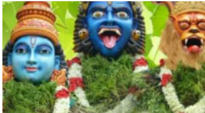
Thrissur deshakummatty faces