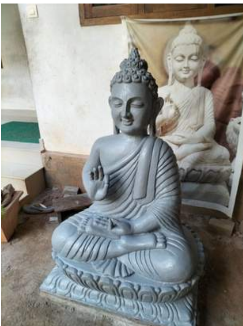
Sculpture of Budhdha