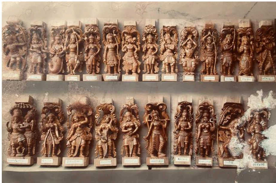
Wooden sculptures of kiratham story - Kolkata guruvayurappan temple