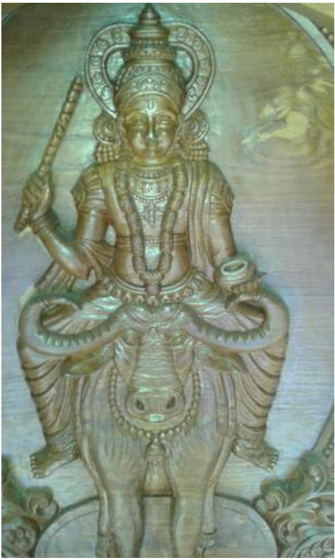
Peringottukara kanadimadam tharavadu temple - Sculpture of Chathan swami