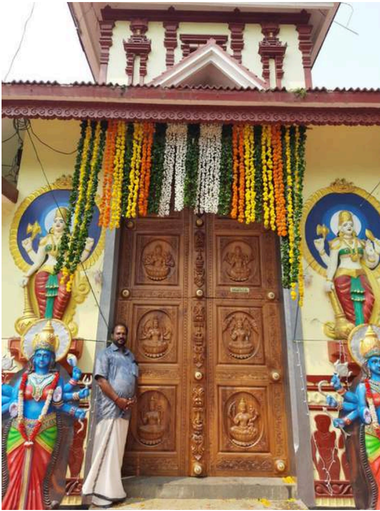
Mannuthy kodungallurkkavu temple main door - Ashtalakshmi