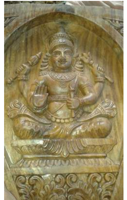
Peringottukara kanadikkavu temple - Navagraha sculpture