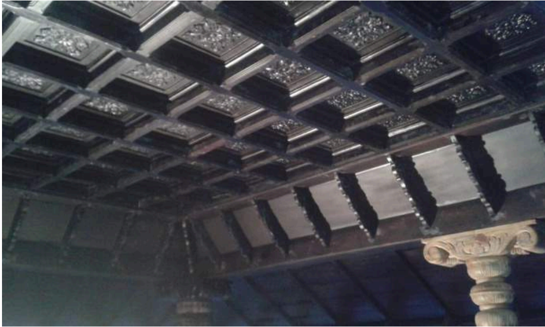
Bangalore sri sri Ravisankar asram - Koothambalam, nalukettu and ettukettu