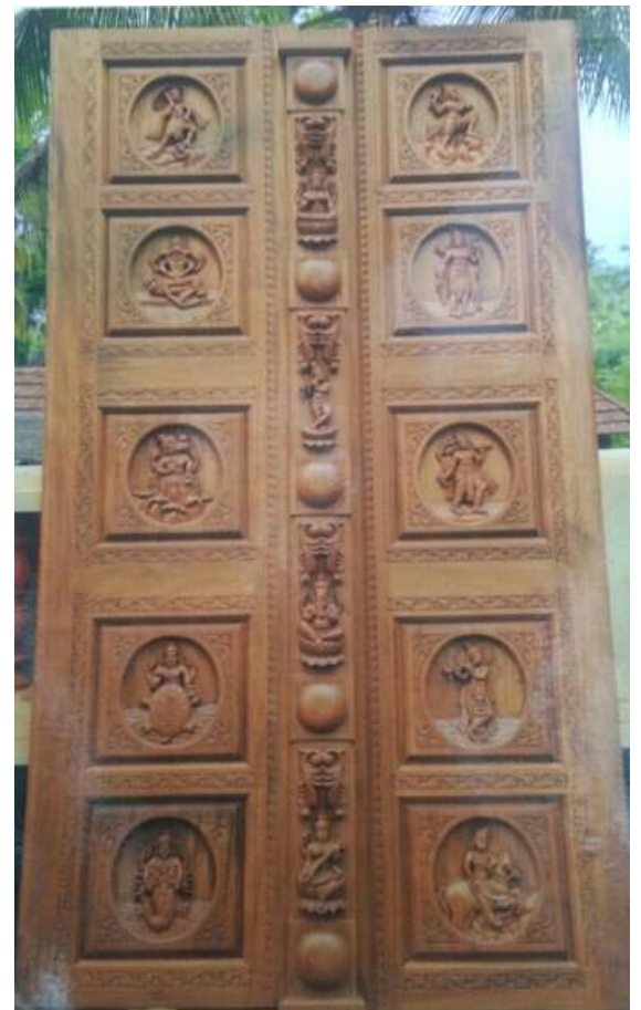
Madras velachery temple main door - Dasavatharam