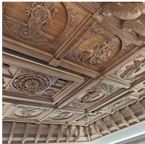
Peringottukara kanadikkavu temple ceiling - Dasavatharam