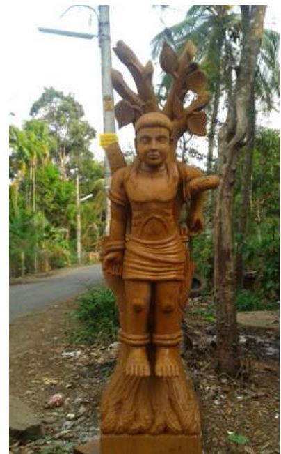
Thazhekkad church - Sculpture of muthappa