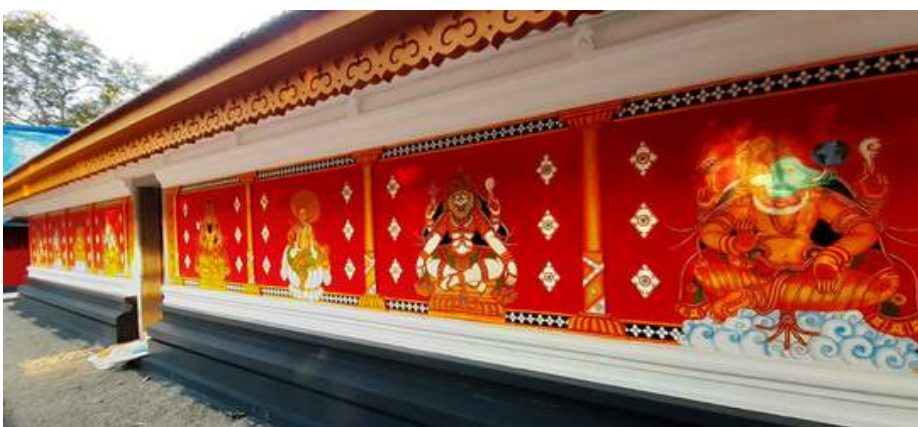
Peringottukara velachery temple