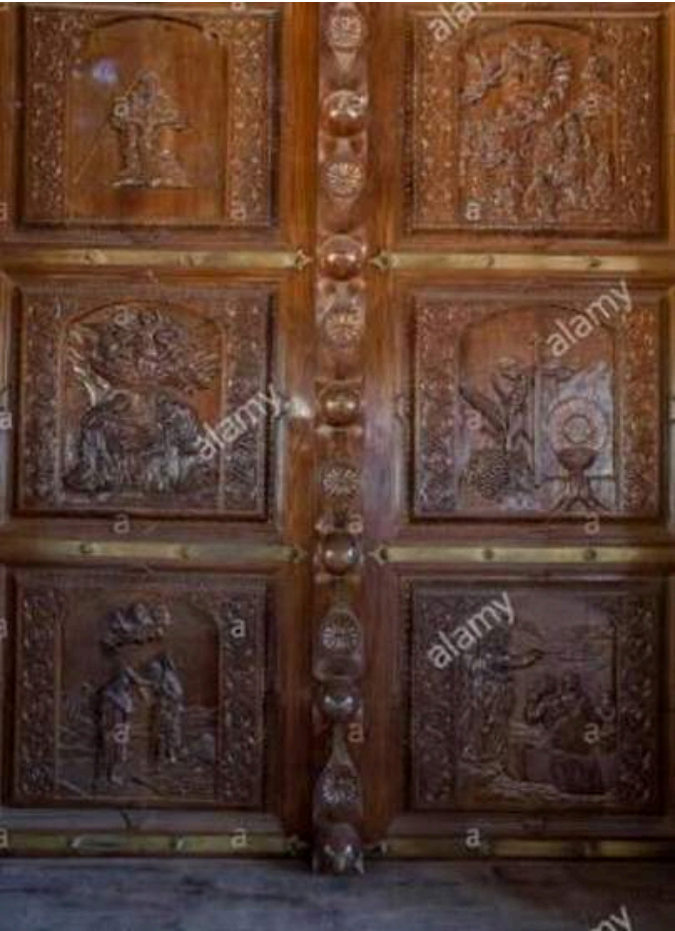
Palayur church main door