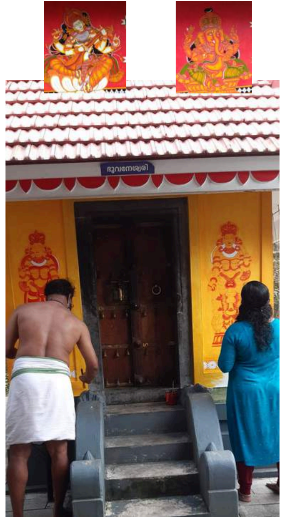
Elavally thindiyath tharavadu temple