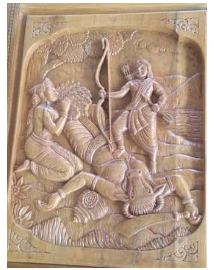
Cheloorkunnu Ayyappa temple - sculpture of Ayyappacharitham