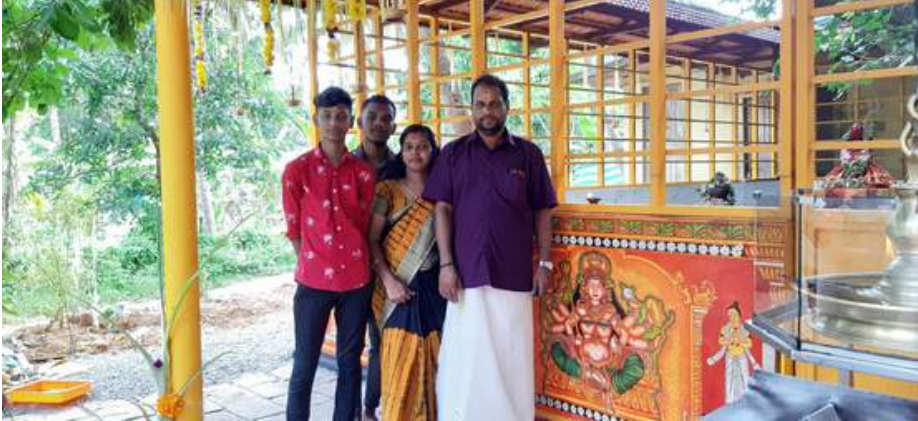
Elavally chovva bagavathy temple