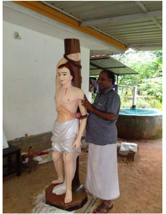
Chittattukara church - Sculpture of Sebastianose